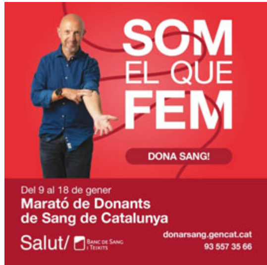
Imatge 2.- Cartellera externa

Cal destacar, per tant, que es prioritza el català sempre que és possible , si bé s'utilitzen altres llengües quan aquestes són triades per donants, pacients o usuaris/àries, o bé quan els missatges es dirigeixen a un públic concret i puntual, nacional o estranger, amb relació al qual es coneix que no disposa de competència lingüística en llengua catalana.