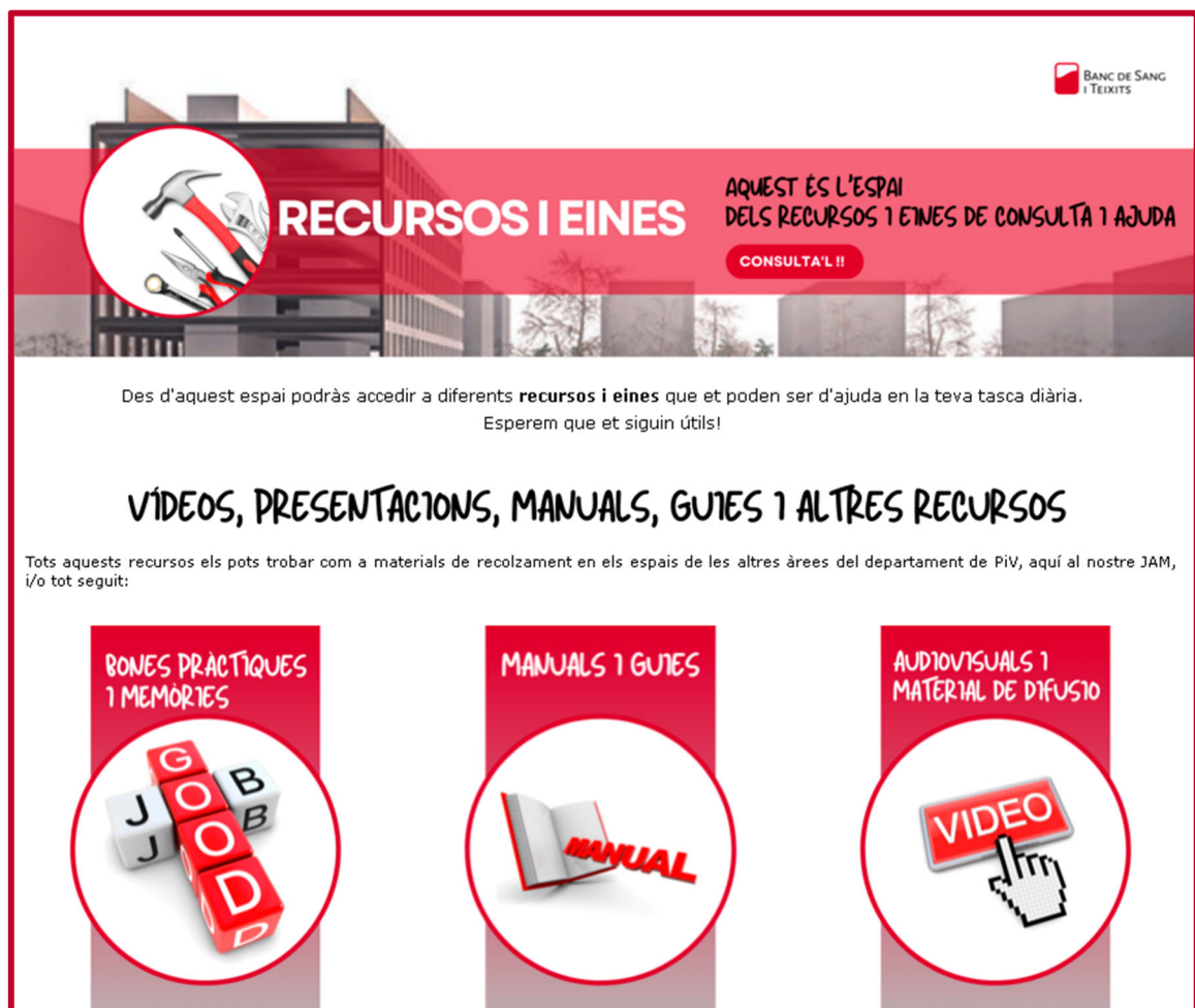
Imatge 7.- Espai comú de recursos i eines de la intranet institucional (SuccessFactors).