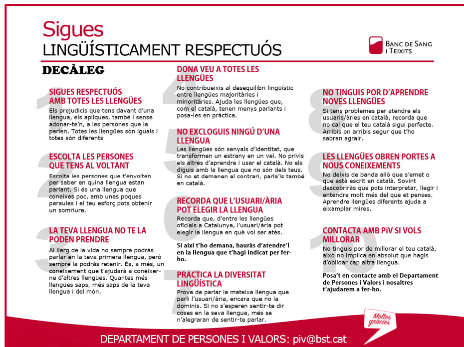
Imatge 5.- Decàleg Sigues lingüísticament respectuós .

Finalment i com a darrer punt del decàleg, també es reitera que, en el cas de voler millorar el nivell de català, sempre es pot contactar amb el Departament de Persones i Valors, des d'on s'ajudarà a fer-ho.