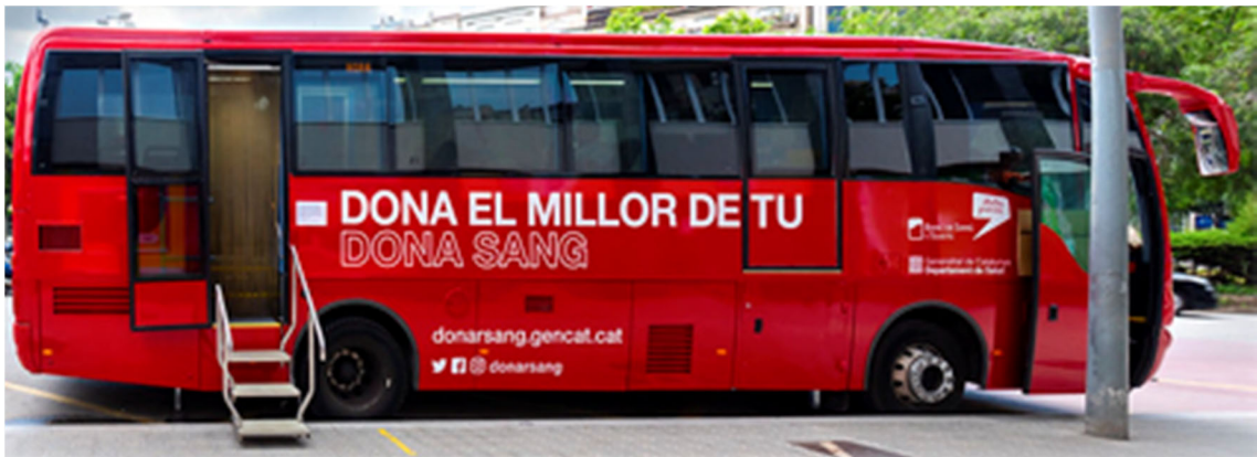
Imatge 3.- Identificació visual de vehicles