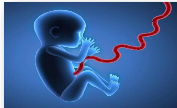
Programa de donación altruista de sangre de cordón umbilical

Recordar que es un curso que hay que hacer cada 2 años