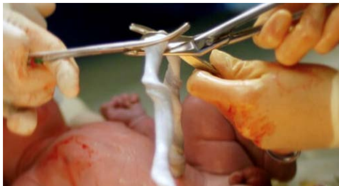
Momento en que se pinza el cordón umbilical para poder proceder a cortarlo.

A día de hoy, hay evidencias que este PTR es beneficioso por el bebé pretérmino o en zonas con elevada incidencia de anemia, porque esta transfusión extra le aporta hemoglobina, hierro y oxígeno extra al bebé y esto puede favorecer su desarrollo posterior.