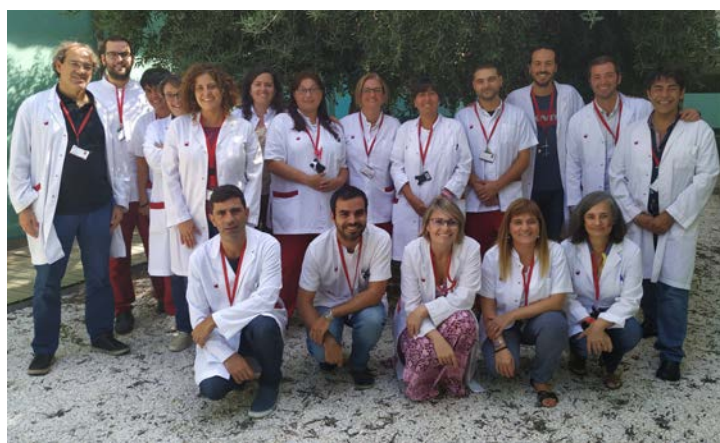
Parte del equipo del Banco de Cordón (Servei de Teràpia Cel·lular del Banc de Sang i Teixits).

Además de hacer posible la transformación de cada donación en medicamentos celulares, el Servicio de Terapia Celular se encarga del trasplante de donantes adultos, la inmunoterapia, los *CARTs y las terapias avanzadas entre otras muchas tareas y otras muchas.