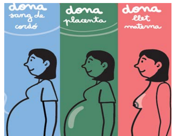
Imagen del Tríptico: Se está iniciando su despliegue poco a poco en centros que pueden implementar este tipo de donación múltiple

Todos ellos han trabajado para asegurar que el circuito funcione bien y los productos lleguen al Banco de Sangre y tejidos a tiempo para poder hacer uso terapéutico.