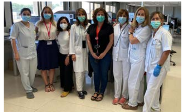
Parte del equipo del laboratorio

“ En nuestro centro estamos muy sensibilizados con el programa de donación de sangre de cordón . Trabajamos en equipo y nos gusta mucho buscar continuamente cómo mejorar el seguimiento del embarazo y la información que se le da a la gestante . Estamos convencidos que ésta es imprescindible para que las gestantes estén tranquilas y por tanto puedan entender y decidir sobre su parto y la posibilidad de ser donantes. Siempre intentamos buscar la mejor forma de hacerlo! Recientemente hemos creado un vídeo gracias a la participación de todo el equipo, donde le explicamos a la gestante todos los puntos importantes que consideramos debe conocer antes del parto: sin lugar a dudas, la posibilidad de ser donante es una de ellas .